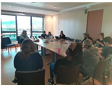
Soirée thématique avec une psychologue

Ces moments de partage et de ressources ont été très appréciés par l'ensemble des personnes accueillies. Elles souhaitent que ce projet puisse être renouvelé en 2024.