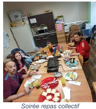
Soirée repas collectif

L'équipe éducative permet aux parents des temps de pause et de répit en leur proposant des sorties uniquement pour eux. En parallèle il leur est proposé un temps de garde des enfants pour leur permettre d'y participer lorsque les familles n'ont pas de solution. Cette année une sortie au SPA de Ribeauvillé a pu être mise en place.