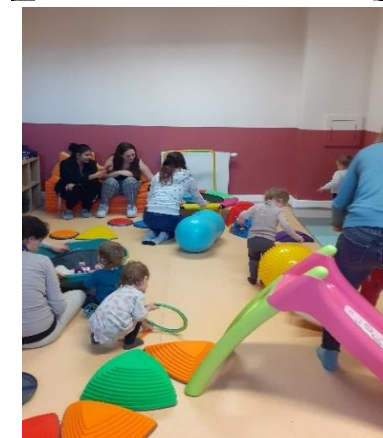
Séance de motricité