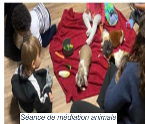
Séance de médiation animale