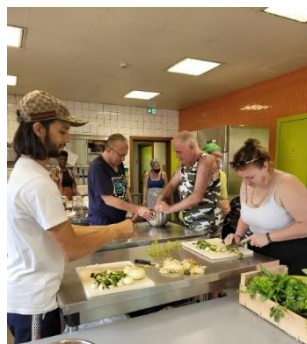
Sortie maison de la nature