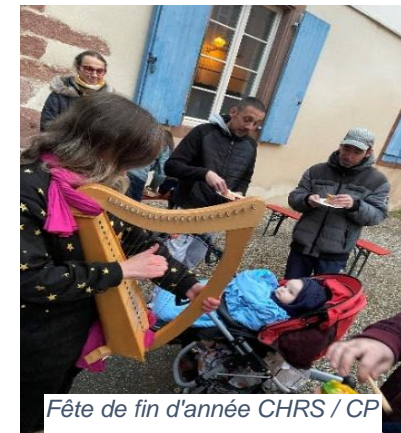
Fête de fin d'année CHRS / CP