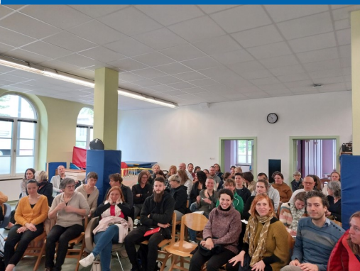
L'ensemble des professionnels de l'IME-SESSAD Pays de Colmar

Le 19 avril, l'ensemble des professionnels de l'IME-SESSAD Pays de Colmar a participé à la démarche de réécriture du projet d'établissement . Cette journée est dédiée aux réflexions des professionnels sur des thèmes sélectionnés, pour construire ensemble des solutions durables dans le cadre du projet d'établissement 2024-2029.